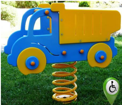
Camion COD. BOD102