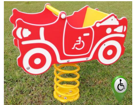
Auto Pippo COD. BOD107

Gioco a molla in polietilene riciclabile colorato con mollone colorato in acciaio temperato che assicura l'anti-schiacciamento delle dita garantendo assoluta sicurezza anche in caso di massimo carico. Adatto ai bambini da 0 a 12 anni. Seduta e Schienale in polietilene. Telaio metallico da interrare. Maniglie e poggiatesta in polietilene. Area di sicurezza Ø 3 mt. - Dimensione variabile circa cm. 40 x 85 x 56