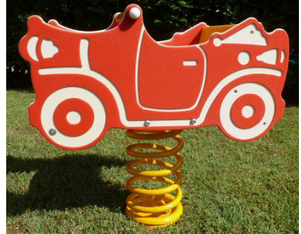
Auto COD. BOD107

Gioco a molla in polietilene riciclabile colorato con mollone colorato in acciaio temperato che assicura l'antisciacchiamento delle dita garantendo assoluta sicurezza anche in caso di massimo carico. Adatto ai bambini da 0 a 12 anni. Seduta in polietilene. Telaio metallico da interrare. Maniglie e poggiatesta in polietilene.