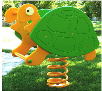
Tartaruga COD. BOD103