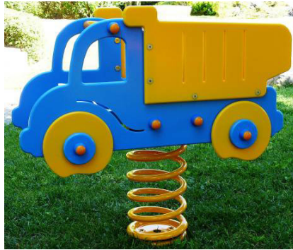
Camion COD. BOD102