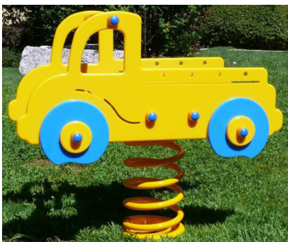
Furgone COD. BOD104