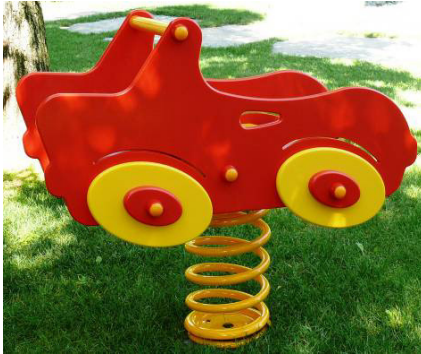
Auto COD. BOD101